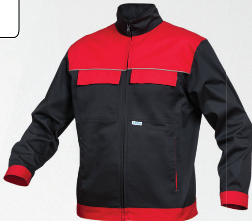
Bluza / Jacket