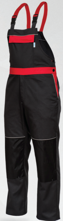
Spodnie ogrodnicze / Bib and brace