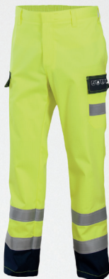
Spodnie do pasa / Trousers