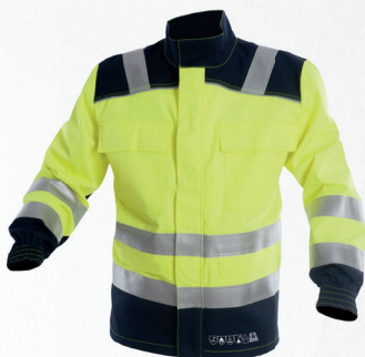
Bluza / Jacket

V Nie czyszczyć chemicznie / Do not dry clean