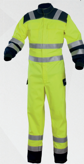
Kombinezon / Coverall