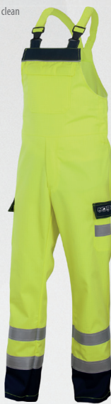
Spodnie ogrodniczki / Bib and brace