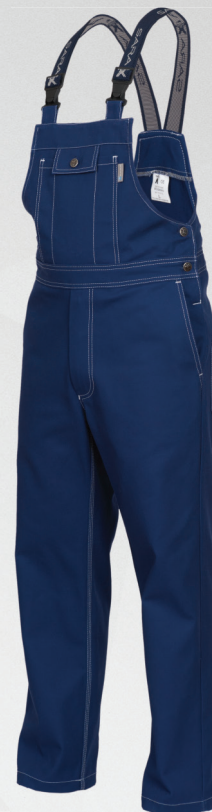
Spodnie ogrodniczki / bib and brace