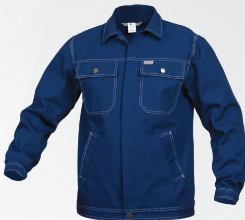
Bluza / Jacket