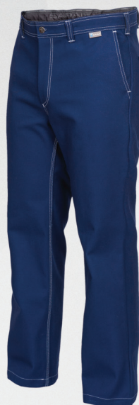
Spodnie do pasa / Trousers