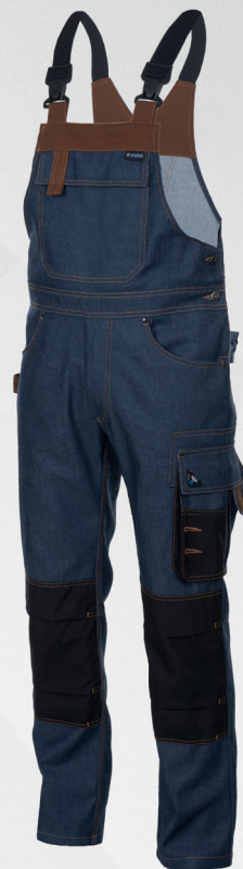
Spodnie ogrodniczki / Bib and brace