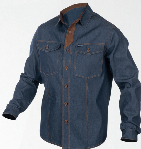
Koszula / Shirt

Uwaga! Prać i prasować na lewej stronie. Note! Wash and iron on the left side.