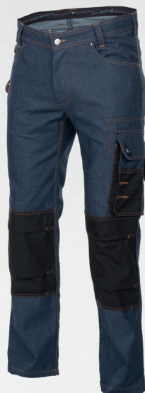
Spodnie do pasa / Trousers