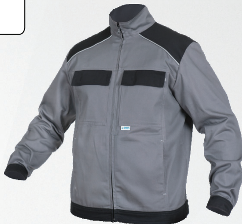
Bluza / Jacket