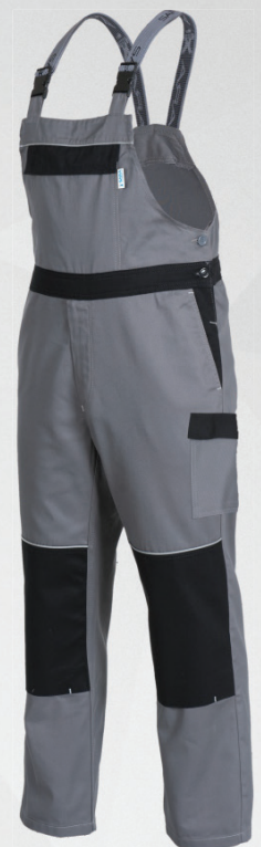
Spodnie ogrodniczk / Bib and brace