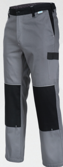
Spodnie do pasa / Trousers