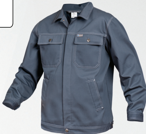
Bluza / Jacket