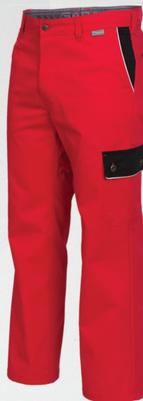
Spodnie do pasa / Trousers