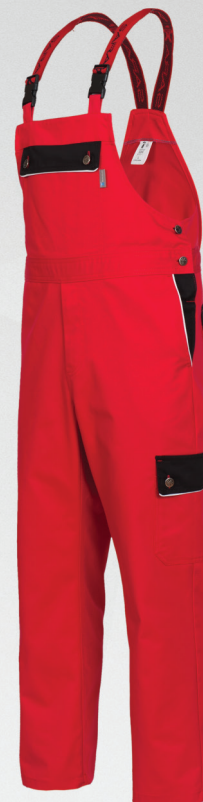
Spodnie ogrodniczki / bib and brace