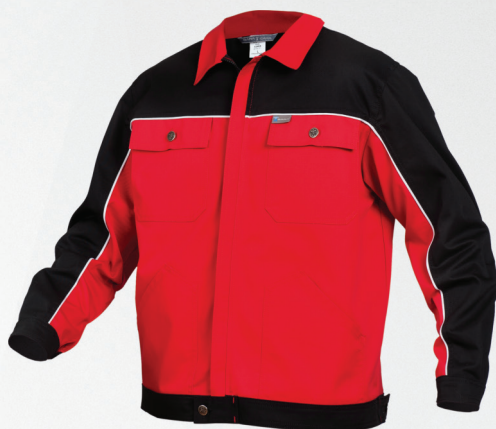
Bluza / Jacket