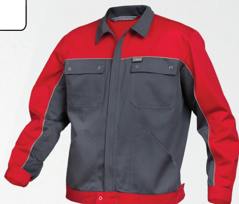
Bluza / Jacket