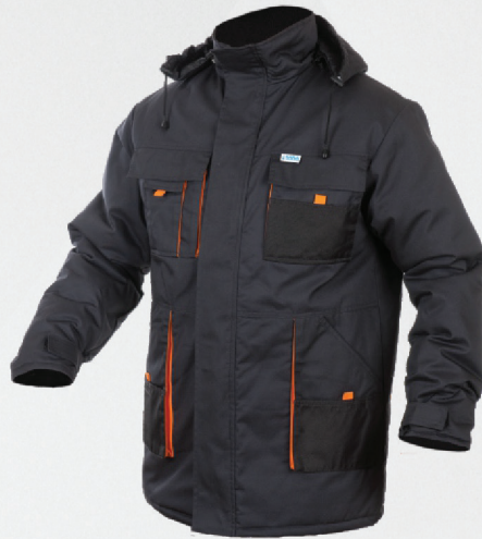
Kurtka długa ocieplana / Insulated long jacket