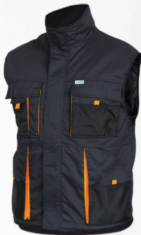
Kamizelka ocieplana / Insulated vest

V Nie czyścić chemicznie / Do not dry clean