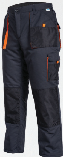
Spodnie do pasa ocieplane / Insulated trousers