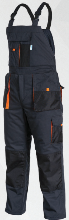
Spodnie ogrodniczki ocieplane / Insulated bib and brace