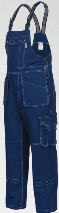
Ogrodniczki monterskie / Bib and brace with extra pockets