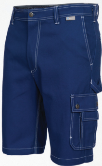
Spodnie krótkie / Shorts

V Nie czyścić chemicznie / Do not dry clean