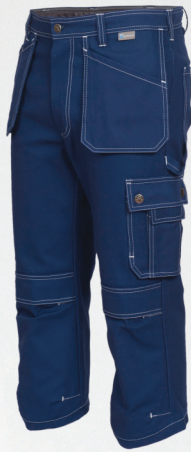
Spodnie ¾ / ¾ Trousers