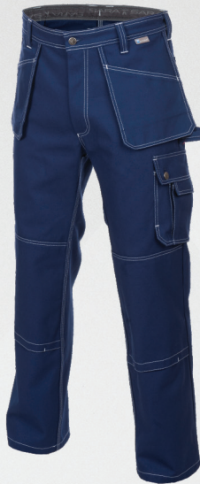
Spodnie monterskie / Trousers with extra pockets