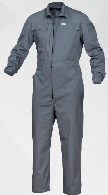
Kombinezon / Coverall