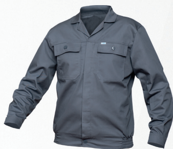
Bluza / Jacket