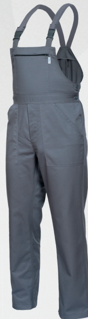
Spodnie ogrodniczki / Bib and brace