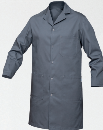
Fartuch / Coat