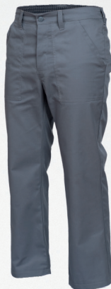
Spodnie do pasa / Trousers